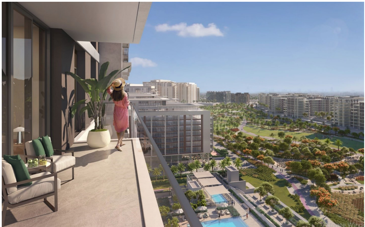
نمای ساختمان از سنترال پارک: