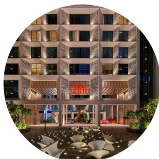
UNITED ARAB EMIRATES

برند 25HOURS در ۱۵ شهر اروپا دارای هتل بوده و دومین هتل خود در دوی و ۱۶ امین در دنیا را به نام 25H Heimat لانچ می نماید.